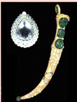
トプカピ宮のダイヤモンドと宝剣

オスマントルコ歴代の王が住んだ王宮には、鶏卵大のダイヤモンドやエメラルド。ハーレムでは千人を超える美女が乱舞！