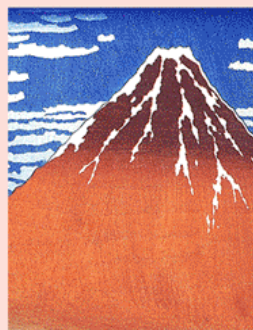
北斎「富嶽三十六景」凱風快晴

「富嶽三十六景」大ヒット！ モネ、ドガなどパリの画家たちが仰天。衝撃を与えた構図・色彩は絵画の世界を変えた