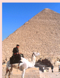
エジプト クフ王のピラミッド

4500年を経て今なお解明されないナゾの数々。230万個の石はどうやって積んだか、内部に発見された巨大空間は？