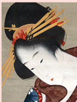
北斎 二美人図 肉筆

地球の生きた年月に比べれば、人類の時間はほんの一瞬に過ぎません。でも、人間はこの一瞬の間にいかに偉大なことをしたか、世界中に遺された遺跡や芸術品を見ると、その偉業がわかります。この講座では、巨大な建造物や天才たちの足跡を追って、人類の“美”を楽しみます。