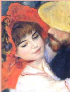
ルノワール「ブーシヴァルの踊り」

世界には多数の美術館・博物館があり、歴史や美術史上の貴重な文化遺産を収集・展示、どれも見応えあるものばかりです。この講座では、それらの中から特に優れた美術館・博物館を厳選し、代表的な収蔵品を詳しく解説、大きなスクリーンでその魅力を紹介します。作品の歴史的意味や出土した遺跡なども訪ね、その背景を探ります。時間に追われる旅の中の美術館鑑賞に比べ、じっくりと世界の名品・名画の細部も楽しむことができます。