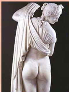
ローマ時代「美しいヴィーナス」