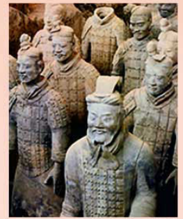
始皇帝陵の兵馬俑

初めて中国を統一した秦の始皇帝は即位直後から墓陵を建設。死後の皇帝を守る土の等身大衛兵8000体も。