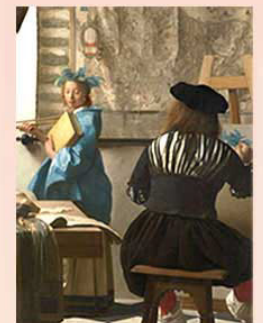
フェルメール「絵画芸術」

ギリシャ・ローマの古代彫刻からフェルメールまで、逸品の宝庫。ブリューゲル「バベルの塔」の名画も。